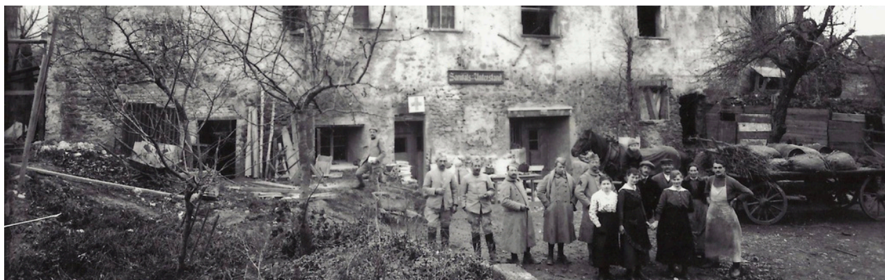
Abri mémoire, Abri sanitaire, 1918

L'exposition Panser en société s'inscrit dans cette continuité : elle propose une étude pluridisciplinaire du care : une pratique relationnelle, collective et profondément politique . Replacer le care comme pilier de l'existence et des relations sociales, c'est aussi contribuer à sa reconnaissance comme force sociale et culturelle .