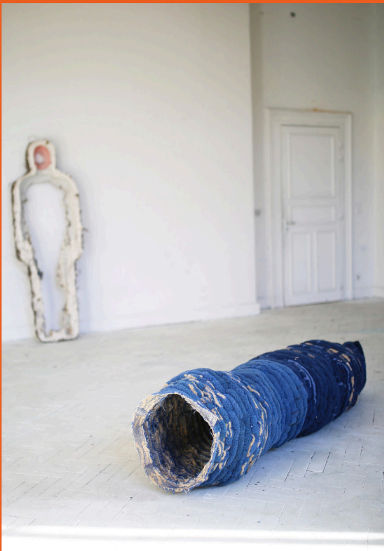
Elie Bouisson, Cocon , 2020