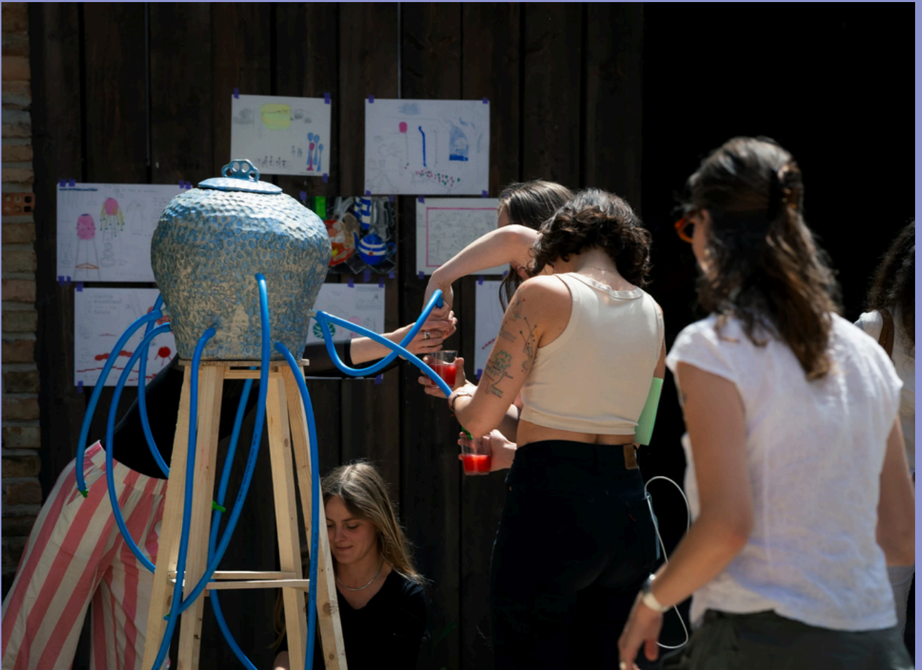
Zoé Saudrais, La théorie du ruissellement , 2025