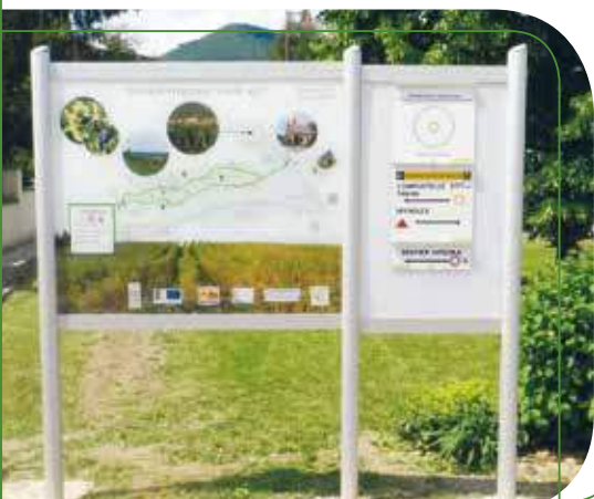
Sentier viticole Cote 425 à Steinbach

Deux nouveaux sentiers viticoles ont été inaugurés il y a quelques jours. Vous pouvez les emprunter depuis :