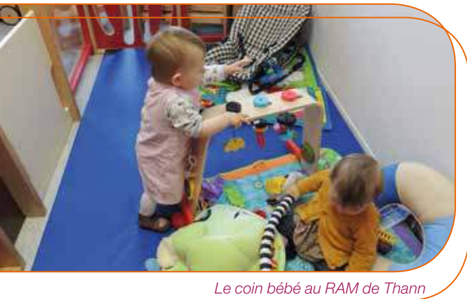
Le coin bébé au RAM de Thann