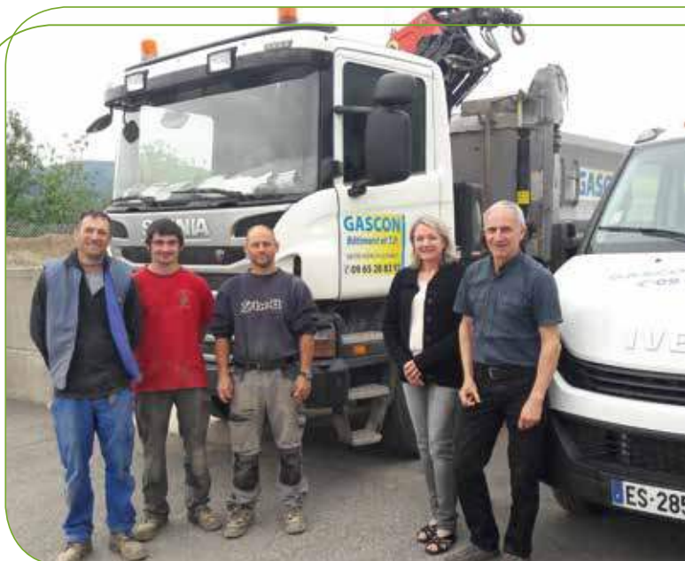
L'équipe de l'entreprise Gascon avec son responsable à droite

Mes salariés (10 à ce jour) habitent majoritairement sur le territoire et certains clients sont aussi sur le secteur. J'ai donc