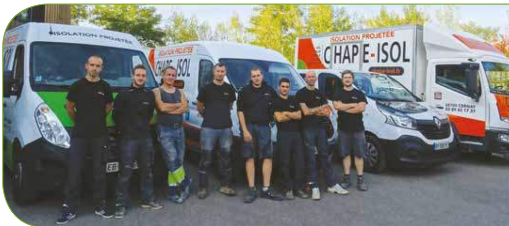
L'équipe de l'entreprise Chape-Isol avec son responsable (4 ème en partant de la gauche)

Elle permet un démarrage avec des frais moindres. Les prestations sont nombreuses et cela permet de ne pas avoir de secrétaire dès la création. La situation du Pôle ENR est idéale, proche des grands axes routiers. Cet ensemble d'éléments favorables à la création de notre entreprise nous ont été d'un réel soutien au démarrage.