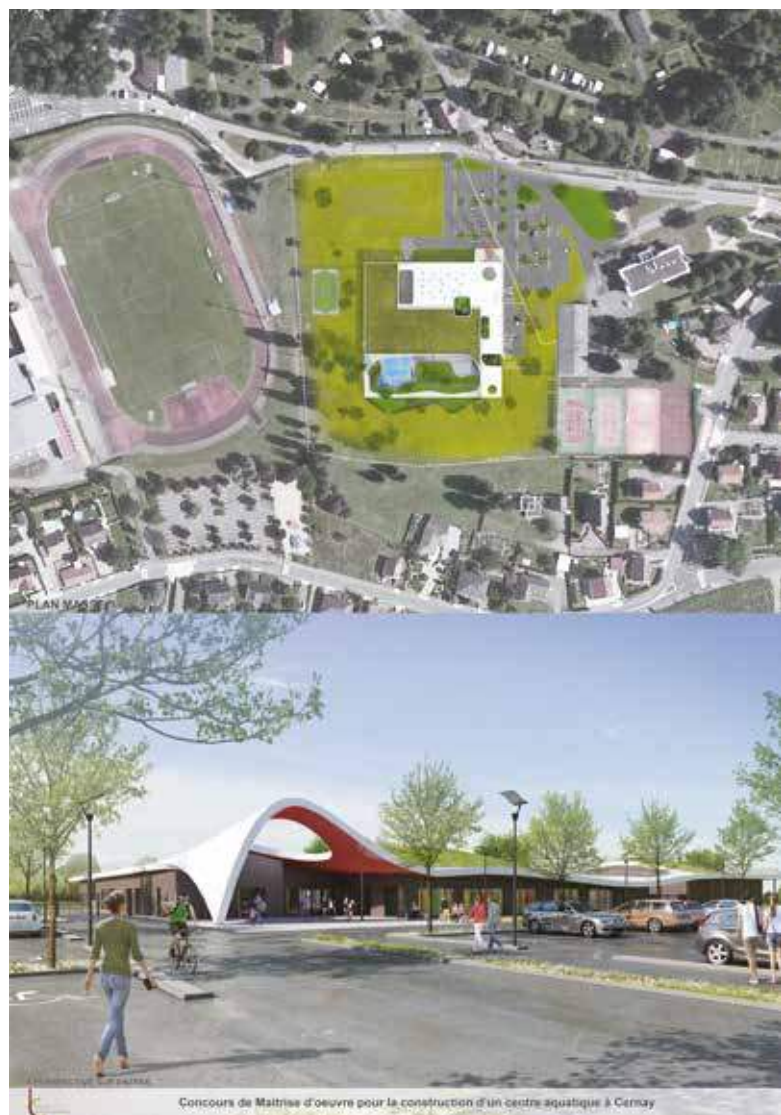
Projet d'entrée de la future piscine