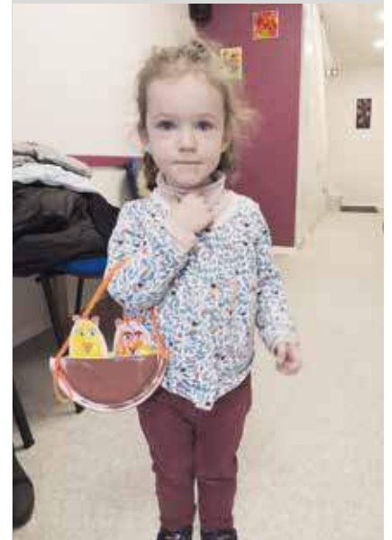
Hall d'entrée du RAM de Thann