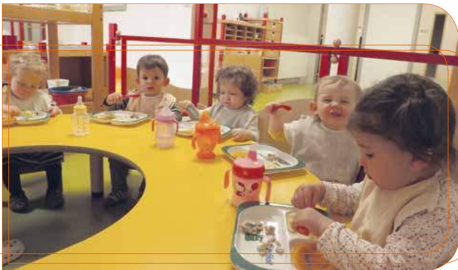
La Farandole à l'heure du repas

Les multi-accueils s'inscrivent dans la démarche menée par la CCTC pour un développement durable. « La Farandole », par