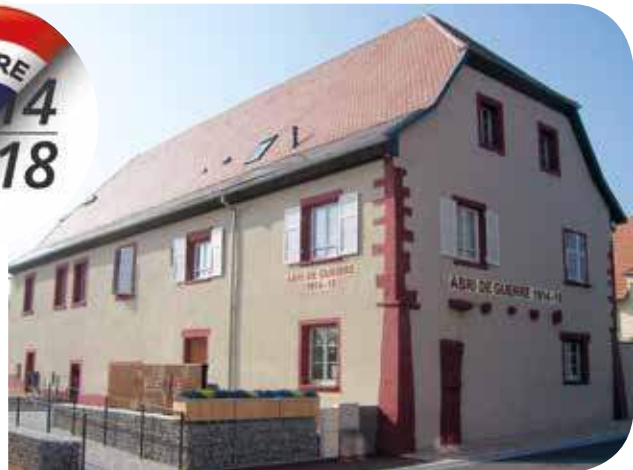
L'Abri-Mémoire à Uffholtz