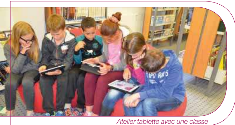
Atelier tablette avec une classe