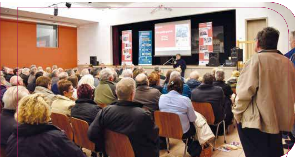
Réunion publique sur la fibre à Wattwiller

Leimbach (pour les habitants) : mardi 3 juillet à 19h à la salle des Fêtes, rue Principale.