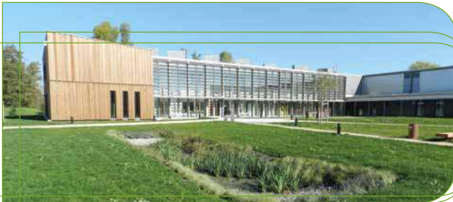
Le Pôle ENR à Cernay