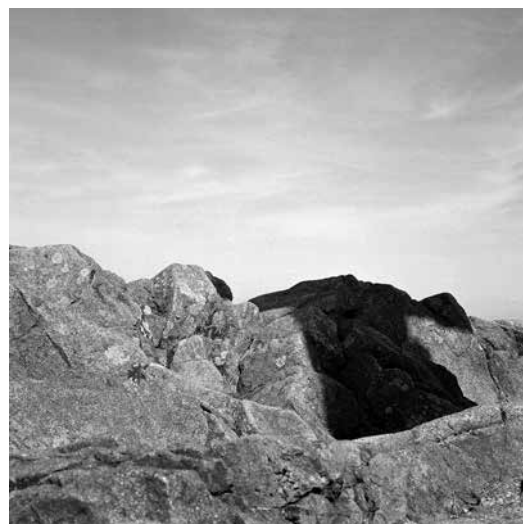
Oeuvre de Nathalie Savey