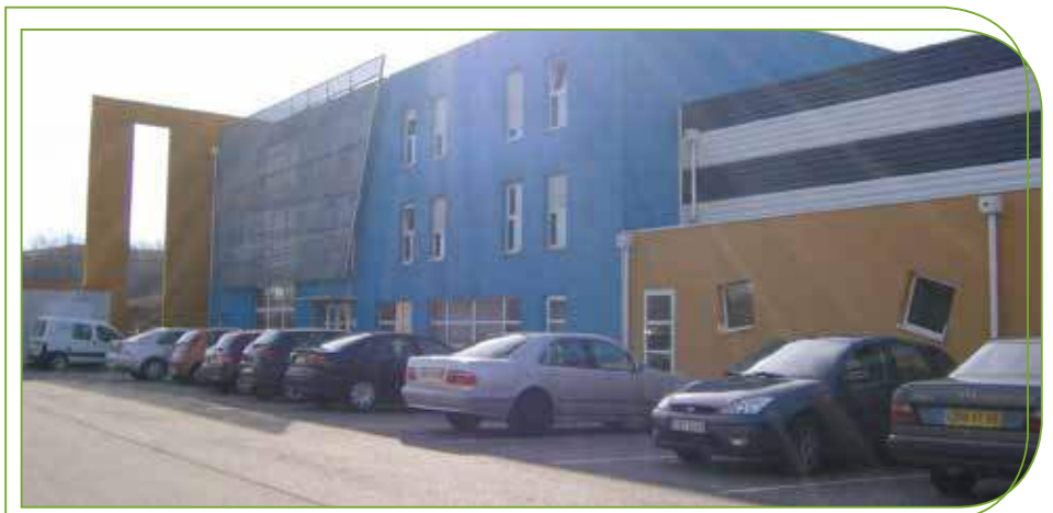
L'Embarcadère à Vieux-Thann