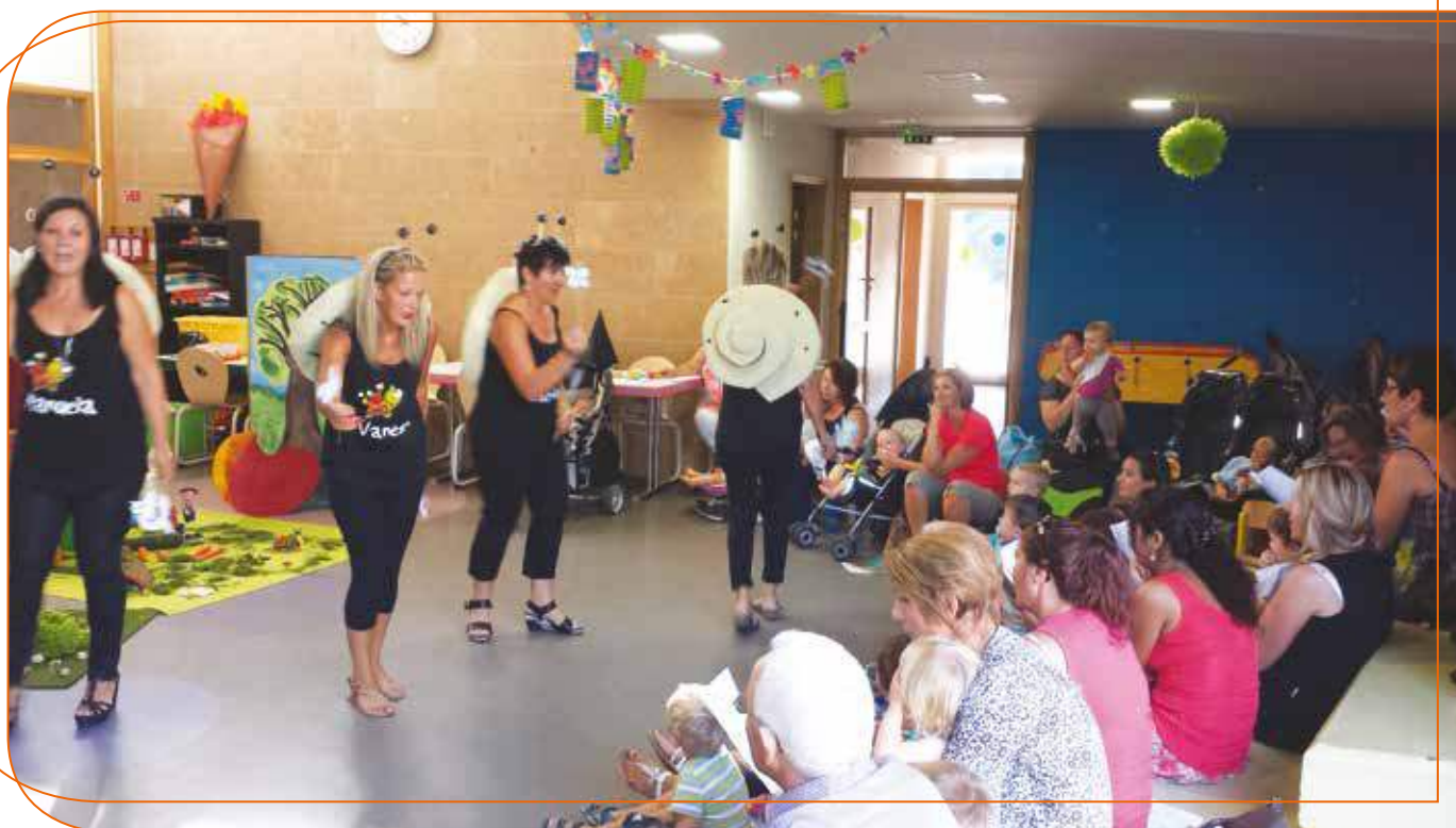
Animation Racont' Nounou