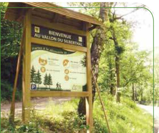
Nouveau panneau d'accueil au Silberthal

L'installation d'un fléchage à partir de Cernay est également prévue. La CCTC, gestionnaire du vallon du Silberthal, a mené cette opération en partenariat avec la commune de Steinbach, l'association Potasse et l'harmonie du Silberthal.