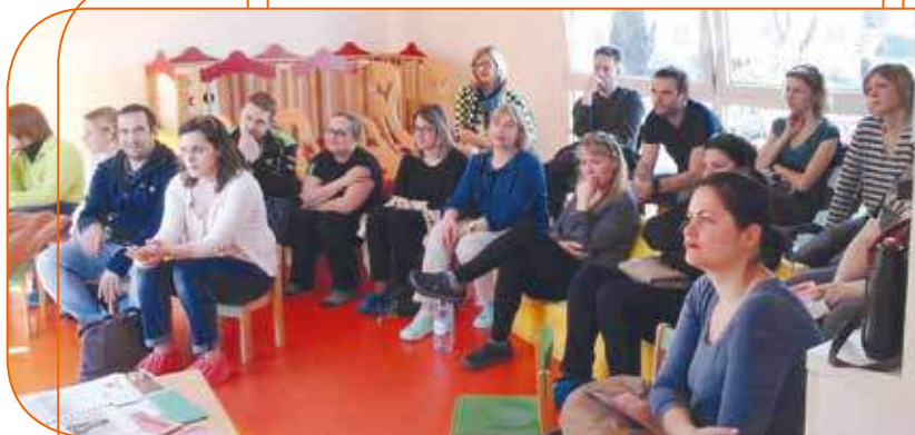
After-crèche à la Farandole

Pour permettre aux familles de se libérer plus facilement, la garde des enfants est assurée gratuitement pendant l'animation (17h30 à 19h30).