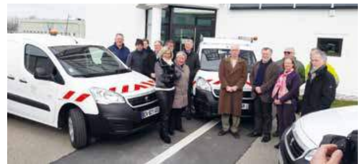
Véhicules électriques achetés pour les communes

Elle mène par ailleurs d'importants travaux de modernisation de l'éclairage public, avec l'installation de luminaires à leds, de variateurs de tension, d'armoires de commande à horloge astronomique... Cela permettra de réduire la consommation d'énergie d'environ 40 %.