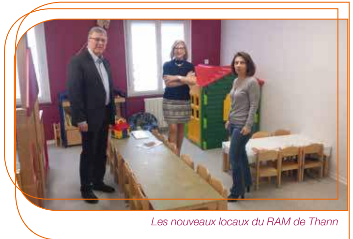
Les nouveaux locaux du RAM de Thann

Et bien sûr avec le Centre socio culturel du Pays de Thann qui porte un projet social et éducatif que nous partageons pour animer et gérer plusieurs structures : le multi accueil Les Marmousets à Thann, la micro crèche La boîte à malices à Bitschwiller-lès-Thann, la micro crèche L'île enchantée à Aspach-Michelbach et un lieu d'accueil enfants parents (LAEP) itinérant.